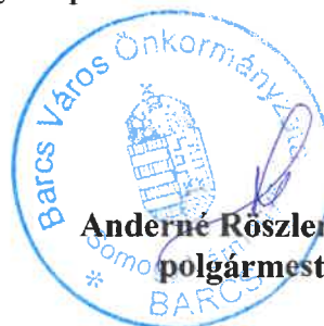
Anderné Rösler Erika polgármester